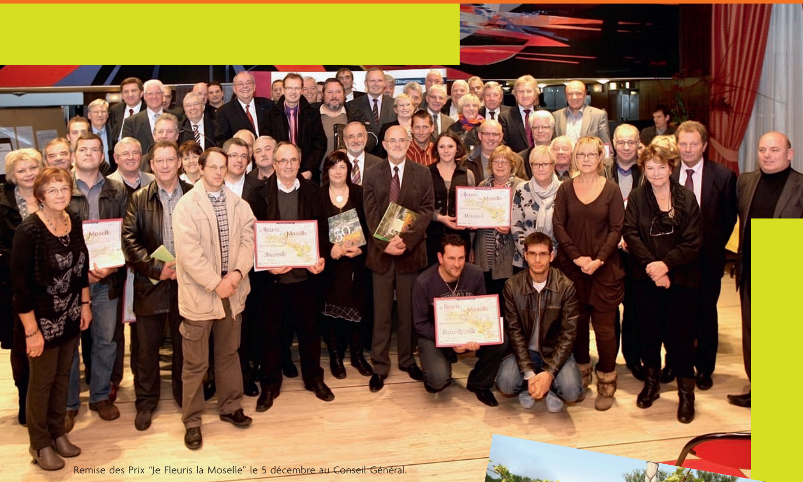
Remise des Prix "Je Fleuris la Moselle" le 5 décembre au Conseil Général.

En Moselle, le tourisme est devenu une filière incontournable créatrice de richesses... et cette filière se porte bien ! Le bilan de l'année touristique est positif : une hausse d'un point du nombre de nuitées dans l'hôtellerie, + 8 % de chiffre d'affaires au service commercial de Moselle Tourisme, + 9 % de fréquentation dans les «Jardins sans Limites»... Les touristes sont toujours plus nombreux dans notre département : le seuil des 5 millions de visiteurs dans les sites et parcs mosellans, sera à nouveau dépassé cette année !