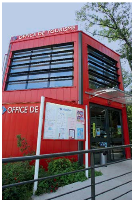
Office de Tourisme d'Amnéville

Nouveaux locaux ou nouvelles organisations... Plusieurs offices de Tourisme du territoire mosellan se sont transformés afin d'offrir à leurs visiteurs un meilleur cadre d'accueil ou une visibilité plus importante.