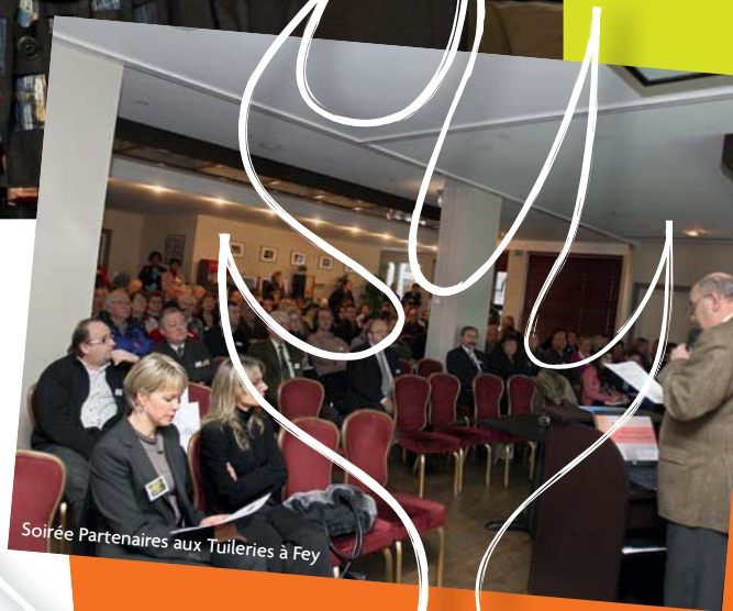
Soirée Partenaires aux Tuileries à Fey

Pompidou, Center Parcs, Niki de Saint Phalle, Ohtehra... Comme si cette année n'était pas encore assez riche en événements, Moselle Tourisme a, en plus, invité le Réseau National des Destinations Départementales (RN2D) qui rassemble les CDT français, à tenir son assemblée générale en Moselle, au Centre Pompidou-Metz les 10 et 11 juin prochains. Nous sommes bien sûr particulièrement fiers d'accueillir toutes les destinations départementales chez nous: c'est une reconnaissance de plus de notre légitimité touristique. Et surtout, nous nous réjouissons de partager en toute amitié avec nos collègues et amis de métropole et d'outre-mer ce superbe printemps du tourisme mosellan.