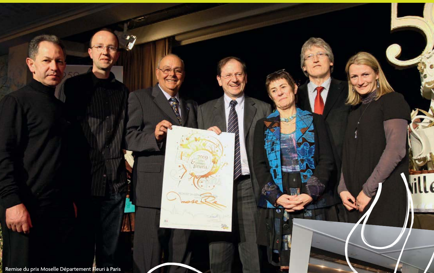
Remise du prix Moselle Département Fleuri à Paris

la lettre de Moselle Tourisme N°7 - avril 2010