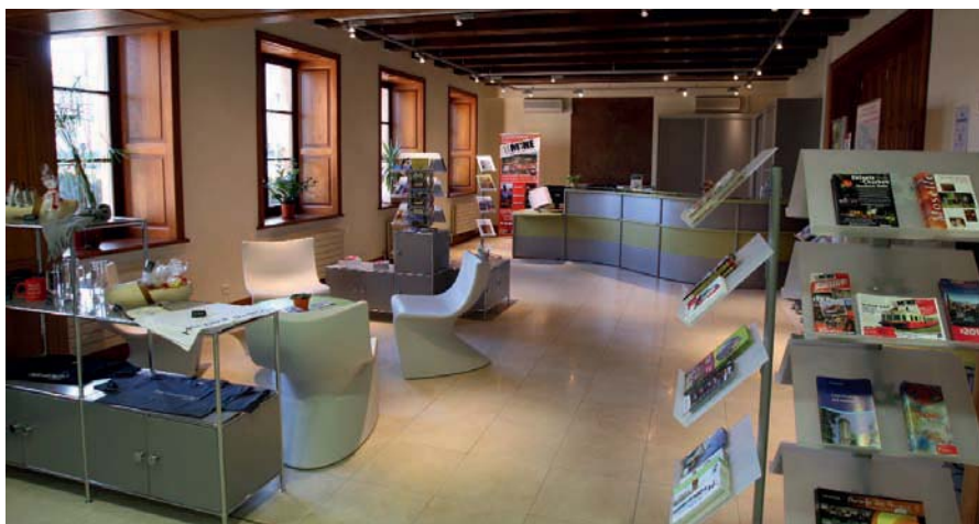
Office de Tourisme de Forbach

A commencer par l'Office de Tourisme de Forbach qui a pris ses quartiers au Château Barrabino (plein centre-ville) et dispose désormais de 350 m 2 (contre 150 m 2 auparavant), d'un accueil handicapés et d'un vaste parking pour les bus. Anciennement près du Pôle thermal, l'Office d'Amnéville qui a fait peau neuve, se situe désormais à l'entrée de la zone de loisirs. Très fonctionnel, il est facilement accessible à tous et notamment aux handicapés. A Sarrebourg, l'Office est maintenant en plein centre-ville, au cœur du Parcours Chagall entre la Chapelle des Cordeliers et le Musée du Pays de Sarrebourg. A Sierck-les-Bains, l'Office immédiatement visible de la rue principale, constitue enfin un véritable point de repère pour les touristes. A Hombourg, l'Office de Tourisme installé dans les locaux de la Villa Gouvy représente désormais l'équipement d'accueil touristique de la Communauté de Communes de Freyding-Merlebach. Un choix opéré pour des raisons logiques de fréquentation.